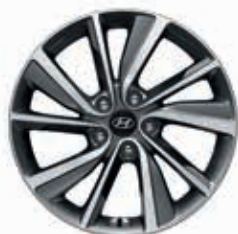
18" Leichtmetallfelge LEVEL 5