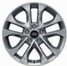
17" Leichtmetallfelge LEVEL 3 / 4