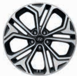
19" Leichtmetallfelge LEVEL 6

6) Leder: Echtleder kombiniert mit hochwertigem Kunstleder